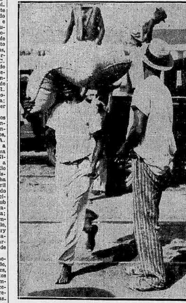
Do cães para o navio que e levará o nosso café para o estrangeiro

Uma conferencia no Departamento Nacional do Café